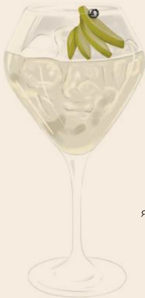
Apple dry spritz игристое/ мартини/ яблоко/ саган- дайля 790